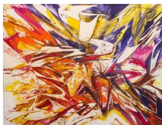
Alltagsnotizem aus Uhlenbuesch