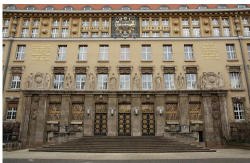
Deutsche Nationalbibliothek Leipzig