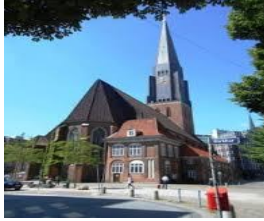
St. Jacobi, Hamburg

Den Rahmen dieser Fahrt bildet auf der Hinfahrt eine Führung an der Arp Schnitgers Orgel in der Hauptkirche „St. Jacobi“. Die Arp-Schnitger-Orgel in Jacobi ist die größte in ihrem klingenden Bestand erhaltene Barockorgel norddeutschen Typs Auf der Rückfahrt machen wir Station in Lüneburg und lernen die Stadt bei einem Stadtrundgang näher kennen.