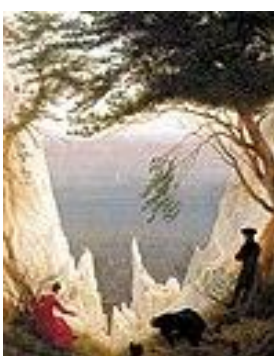
Kreidefelsen auf Rügen

Das Verhältnis von Mensch und Natur ist gerade in unserer heutigen Zeit aktueller denn je.