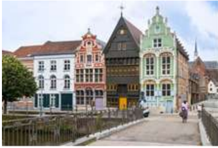
Kranbrug mit Häusern aus dem 16.h.