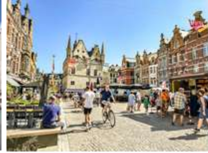
Ijzerenleen , Schepenhaus